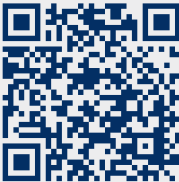
Saiba mais sobre este colchão